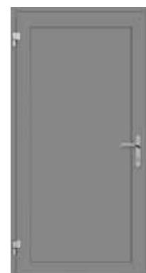
Innenseite / Vue intérieur