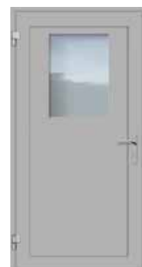
Innenseite / Vue intérieur