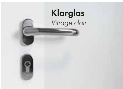
Klarglas Vitrage clair

Die passende Verglasung für eine Aluminium-Haustür sollte sowohl funktional als auch optisch harmonisch zum Design der Tür und des Hauses passen. Für moderne, schlichte Türen eignet sich oft klares oder leicht getöntes Glas, während für mehr Privatsphäre Milchglas oder satiniertes Glas eine gute Wahl ist. Zudem kann die Verglasung zur Sicherheit und Wärmedämmung beitragen. So wird die Verglasung zum stilvollen und praktischen Element.