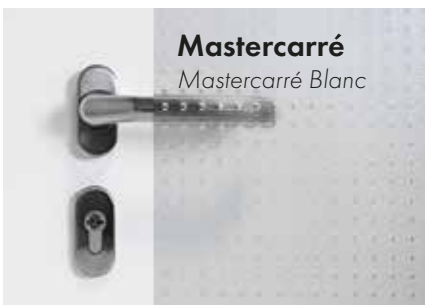
Mastercarré Mastercarré Blanc

Coefficient U g du vitrage 1,0 W/(m 2 K)