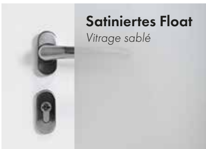
Satiniertes Float Vitrage sablé